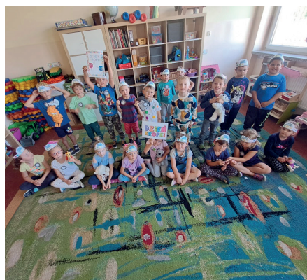
Dzień Kropki w przedszkolu