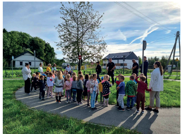
Spotkanie z Policją