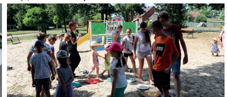
Wakacje w Ojerczach