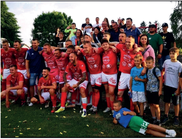
Victoria z kibicami