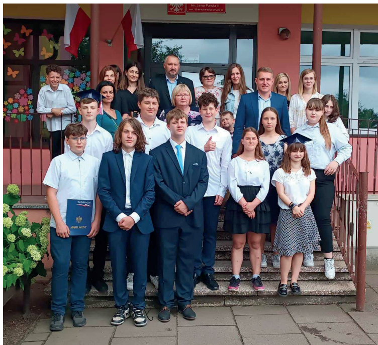
Pożegnanie klasy ósmej

22 września dołączyliśmy, jak co roku, do Akcji Sprzątania Świata. Hasłem przewodnim akcji jest: „Sprzątanie świata łączy ludzi”. Obie grupy przedszkolne posprzątały teren wokół naszej szkoły. Zebrałyśmy 3 worki śmieci. Celem akcji „Sprzątania