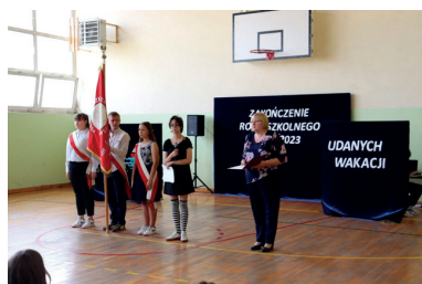
Zakończenie Roku szkolnego 2022 - 2023.

świata” jest budowanie świadomości ekologicznej oraz inicjowanie działań na rzecz ochrony środowiska - poczynając od uprzątnięcia śmieci, poprzez promocję i stosowanie selektywnej zbiórki odpadów po długofalowe, rozbudowane programy ekologiczne. Udział w takiej akcji ma na celu poszerzenie świadomości ekologicznej dzieci i młodzieży. Biorąc bezpośredni udział w tym wydarzeniu, młodzi ludzie mają szansę zobaczyć na własne oczy skutki braku poszanowania wobec środowiska naturalnego.