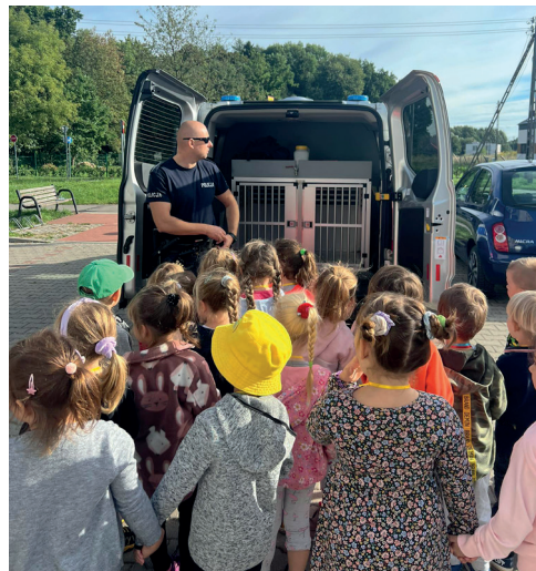
Europejski Tydzień Mobilności

Wydarzeniem rozpoczynającym nowy rok szkolny 2023/2024 w naszym przedszkolu, było zorganizowanie zajęć adaptacyjnych dla nowo przyjętych przedszkolaków. Podczas zajęć dzieci miały okazję zwiedzić budynek przedszkola oraz poznać pomieszczenia znajdujące się w przedszkolu. Czas umiliły rytmiczne zabawy przy muzyce.