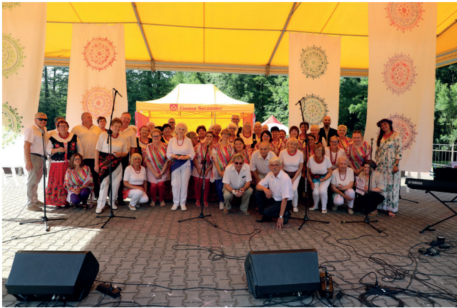
Świętojański Międzypokoleniowy Piknik Zespołów Śpiewaczych