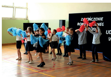
Zakończenie Roku Szkolnego